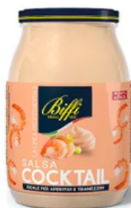
SALSA COCKTAIL --- COD. 38137 ---