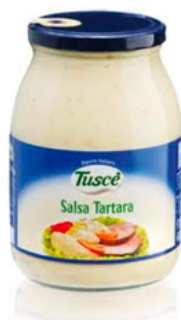
SALSA TARTARA --- COD. 80543 ---