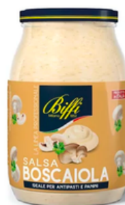
SALSA BOSCAIOLA --- COD. 40055 ---