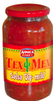
SALSA DIP --- COD. 03012 ---