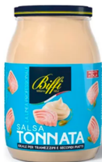
SALSA TONNATA --- COD. 38136 ---