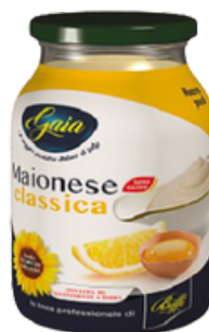
MAIONESE --- COD. 43027 ---