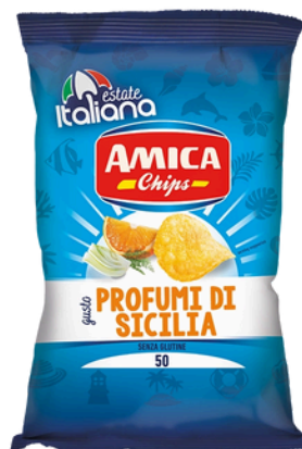
PATATINA PROFUMI DI SICILIA