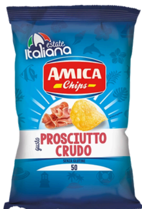
PATATINA PROSCIUTTO CRUDO