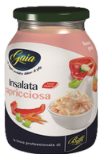
SALSA CAPRICCIOSA --- COD. 33597 ---